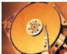
Assistência Técnica ao Hardware e Software